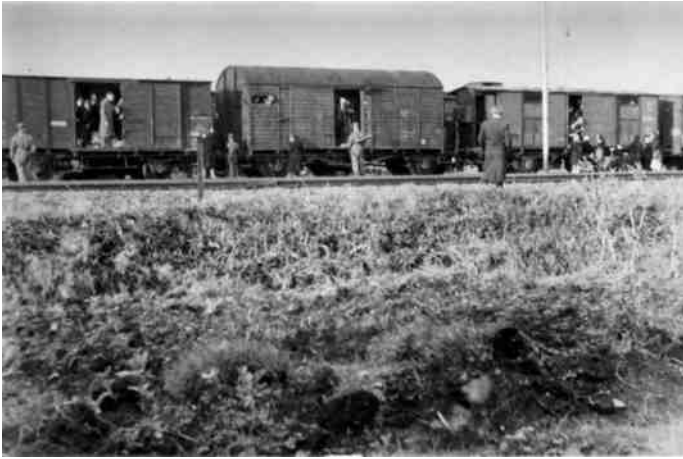
Treinen werden volgestouwd met gevangenen en gingen op transport.

Tijdens de dodenmarsen kwamen minstens 6.000 gevangenen om het leven door uitputting of executie. Op hun tocht naar het noorden stuitte een deel van de gevangenen op het Zweedse Rode Kruis dat hen voedsel en medicijnen verstrekke. Op 3 mei 1945 naderde de colonne het Rode Leger, waarop de SS-bewakers op de vlucht sloegen. Andere overlevenden ontmoette tussen de plaatsen Parchim en Schwerin troepen van de geallieerden.