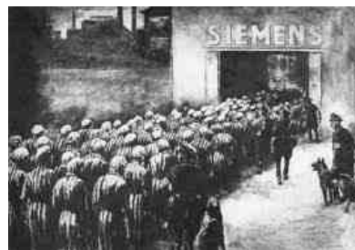
De gevangenen werden bij Siemens en andere bedrijven door SS'ers met bloedhonden naar hun werk begeleid.

In het kamp Sachsenhausen werden vele gevallen van dysenterie geconstateerd. Dagelijks werd de lange mars gemaakt naar de Heinkelhallen. De gevangenen liepen over basaltwegen en de meesten van hen waren barrevoets. Zieken moesten door de gevangenen zelf worden meegezeuld. Als de voortgang van de karavaan enigszins vertraagde, sloegen vooral de jonge SS'ers er als gekken op los. Bij de bewaking werden honden ingezet die te pas en te onpas in de benen van de gevangenen beten. De honden werden al ingezet als ze het waagden iets langzamer te lopen om te proberen even tot rust te komen. Op hulp of medeleven van omstanders hoefden zij niet te rekenen. Van de plaatselijke bevolking vielen hen slechts haat en hoon ten deel.