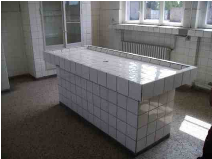
De snijtafels waarop medische experimenten met gevangenen werden uitgevoerd.

Daar aangekomen werden ze in een grote vliegtuighangar ondergebracht. Hoe meer gedetineerden daar werden samengebracht, hoe slechter de leefomstandigheden waren. Duizenden waren er eerder al gestorven aan ondervoeding, ziekte, uitputting en mishandelingen. Als straf en als voorbeeld voor anderen werden velen in het bijzijn van medegevangenen terechtgesteld. In kamp Sachsenhausen vonden onder meer ook medische experimenten plaats.