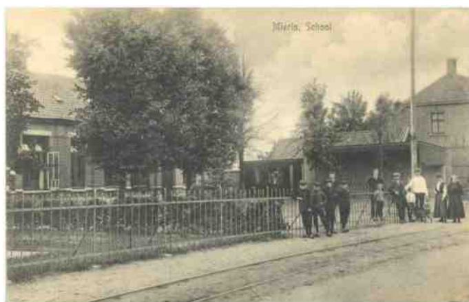
De rooms-katholieke jongensschool aan de Dorpsstraat in Mierlo.