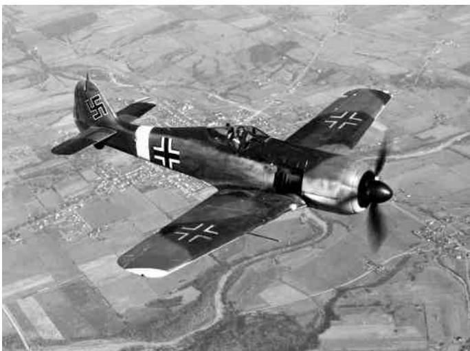
Duitse bommenwerpers werden door de dwangarbeiders geassembleerd en zo nodig gerepareerd.

Tienduizenden gevangenen, onder wie ook Jan, werden vanuit Sachsenhausen als arbeidskrachten ingezet, ter vervanging van de Duitse werknemers die voor volk en vaderland moesten strijden. Bewapeningsbedrijven zoals Heinkel Flugzeugwerke, profiteerden volop van de dwangarbeid. In de Heinkelhallen werden onder meer Duitse bommenwerpers geassembleerd.