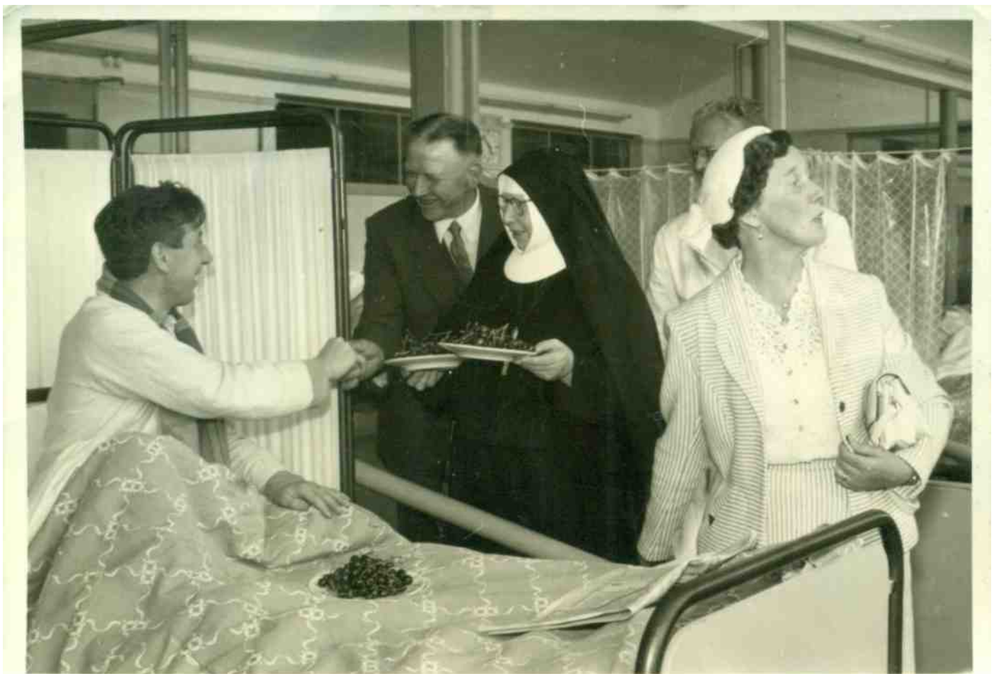
Tijdens het jaarlijkse Kersenoogstfeest in Mierlo was het een goed gebruik dat de patiënten in het Bakelse sanatorium een schaalteje 'Mierlose zwarte' als extra vitamine kreeg.