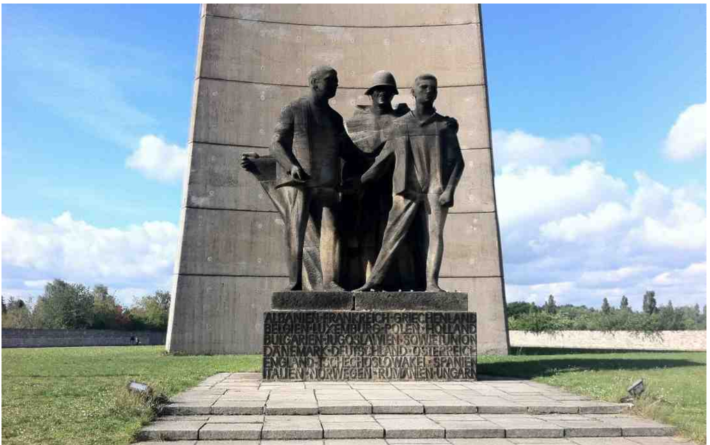
Oranienburg, het herinneringsmonument van het concentratiekamp Sachsenhausen.